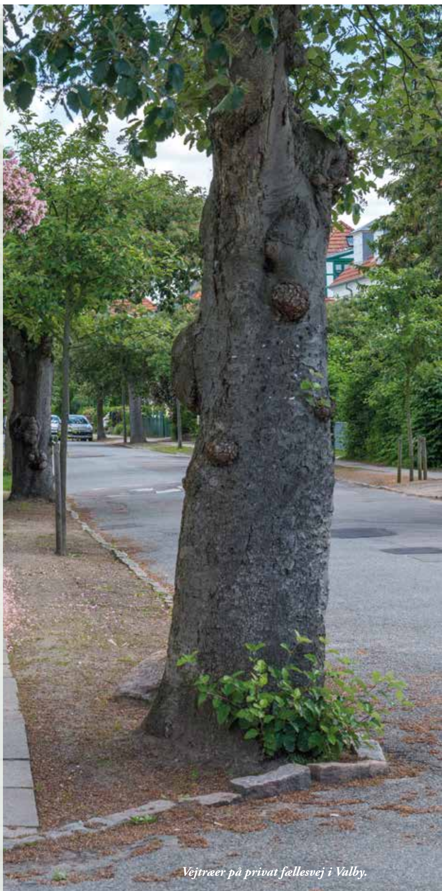
Vejtræer på privat fællesvej i Valby.

Vær opmærksomme på, at vejtræet får nok åben jordoverflade og eventuelt et rodvenligt bærelag. Regn med, at der skal graves ca. 10 kubikmeter jord op, som skal erstattes af god plantejord. Husk at sikre jer, at der er ordentligt drænet omkring hullet, så træet ikke drukner. Desuden skal man sikre sig, at træet får vand nok i tørkeperioder. Der skal ydermere være en kronfrihøjde på 2,8 meter over fortov og cykelsti og 4,5 meter over vejen.