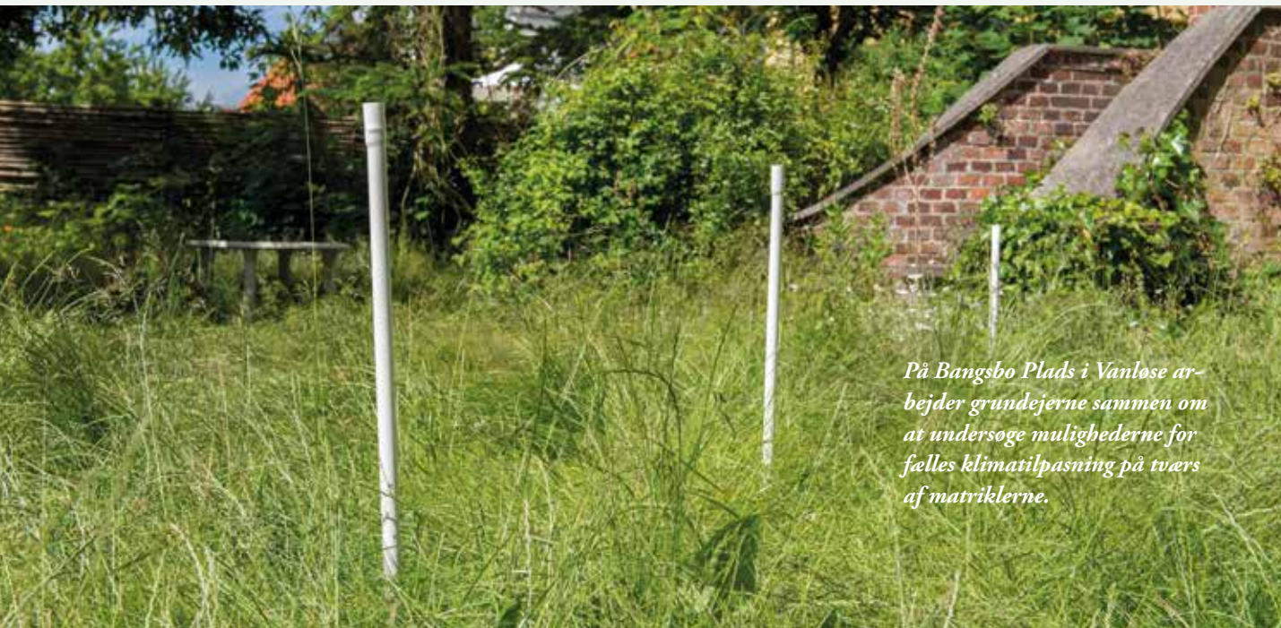
På Bangsbo Plads i Vanløse arbejder grundejerne sammen om at undersøge mulighederne for fælles klimatilpasning på tværs af matriklerne.

Grundejerforeningen åbnede deres projekt op for alle, der var interesserede i at bidrage og lære af det. På den facon betalte Arbejdernes Landsbank og Grundejeren.dk for forundersøgelser af jorden i området, mens Vanløse Lokaludvalg og Københavns Kommune så en interesse i at give et bidrag til at opføre fire testfaskiner i foreningen. En faskine er et hulrum i jorden, hvor regnvandet ledes til, for langsomt at sive videre ud i jorden (læs mere om faskiner på www.have-selskabet.dk ). De fire faskiner er opført i fire haver med forskellige forhold, for at undersøge hvilke uønskede stoffer, der ophobes i jorden, hvis man eksempelvis nedsiver regnvand, der har løbet i en zinktagrende. Målet for Grundejerforeningen Katrinedal er at bruge deres erfaringer til at anlægge fælles faskiner mellem flere skel.