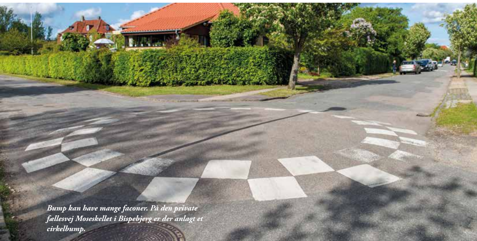
Bump kan have mange faconer. På den private fællesvej Moseskellet i Bispebjerg er der anlagt et cirkelbump.