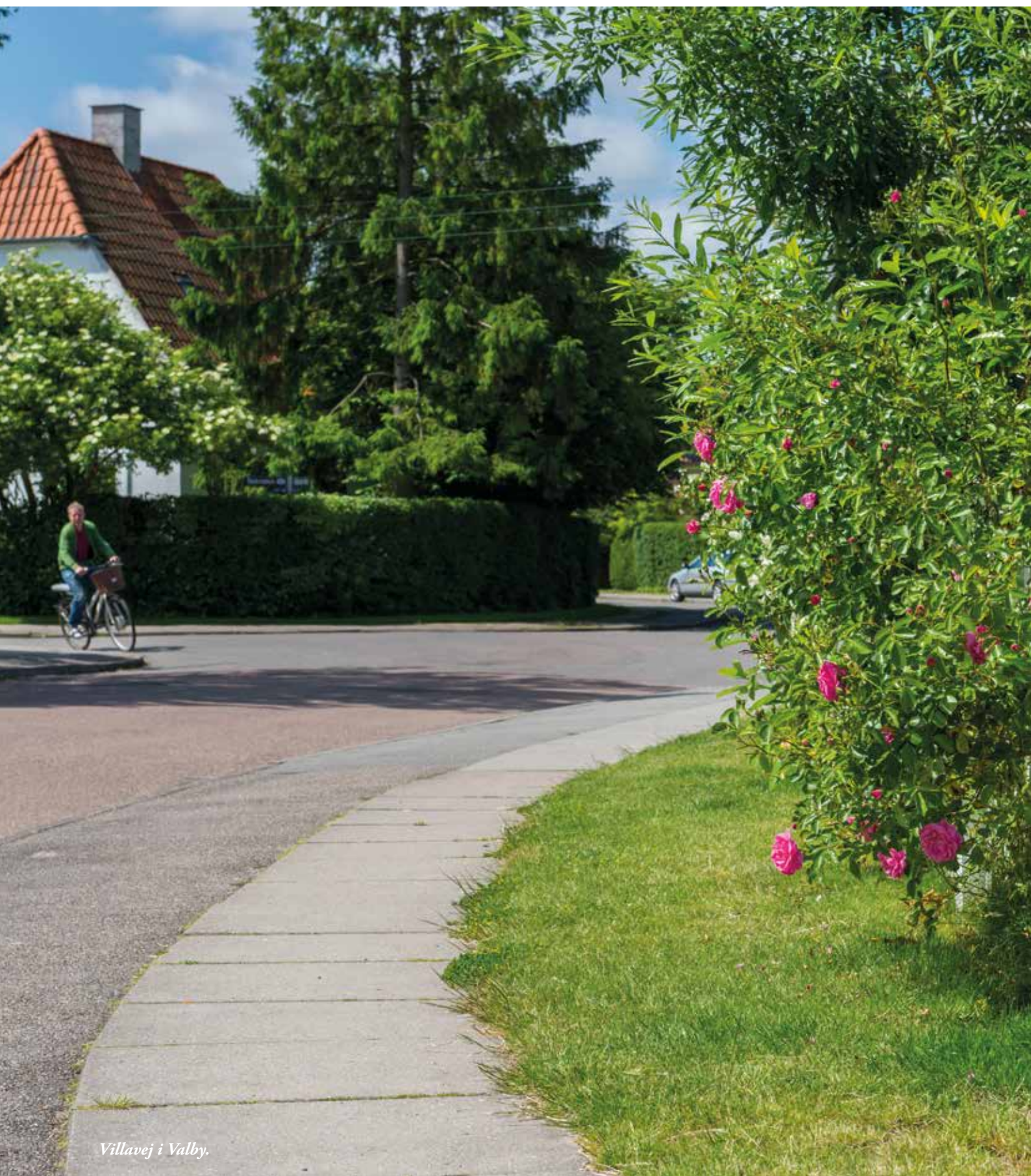
Villavej i Valby.