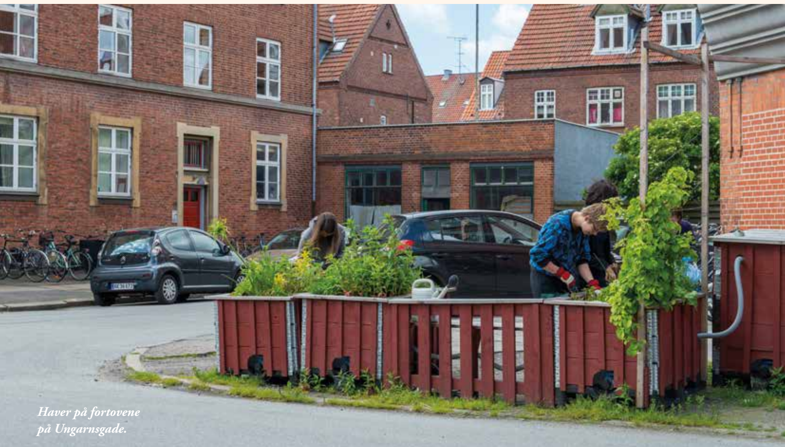
Haver på fortovene på Ungarnsgade.

At dyrke grønt kan handle om meget mere end at dyrke mad. Potter med blomster på fortovet, træer i vejkanten, klatreroser op ad bygningerne, en bæk i skyggen af et æbletræ er alle tiltag, der kan gøre gaden og gården mere grøn, tiltrækkende og levende. Og til et sted, hvor I kan slappe af og møde hinanden.