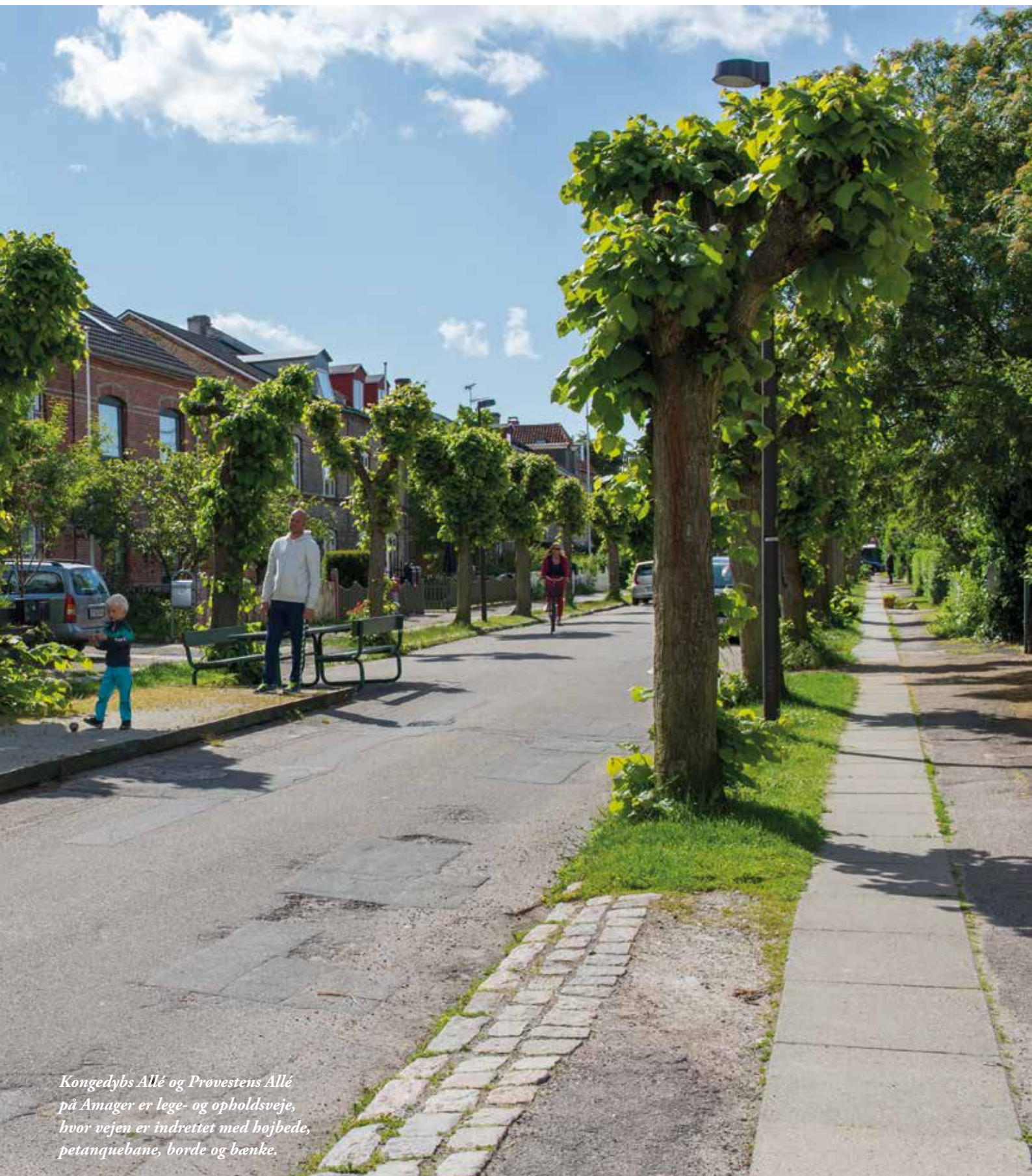
Kongedybs Allé og Prøvestens Allé på Amager er lege- og opholdsveje, hvor vejen er indrettet med højbede, petanquebane, borde og bænke.