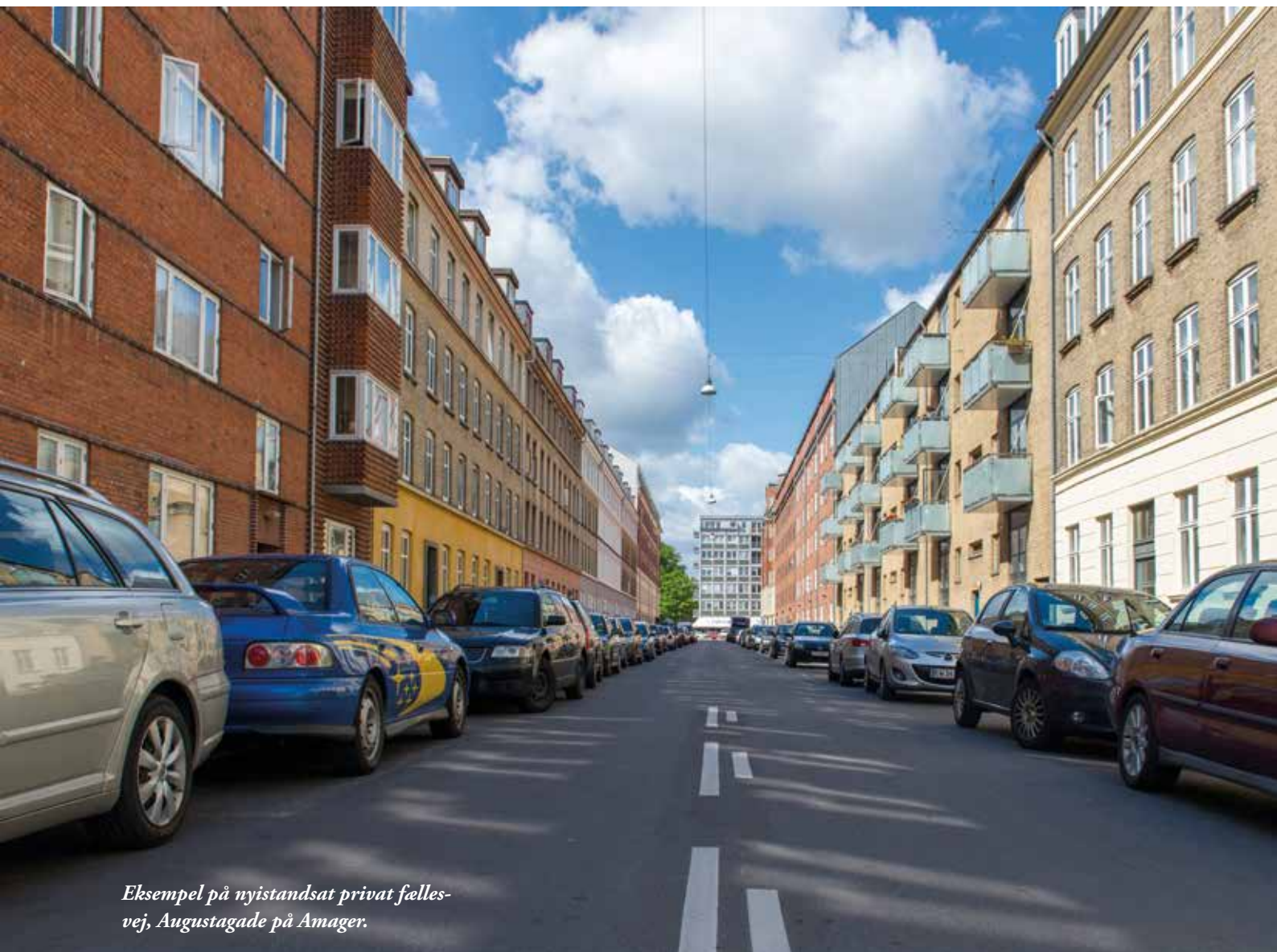
Eksempel på nyistandsat privat fællesvej, Augustagade på Amager.

Det er selvfølgelig også en mulighed at lade vejen forfalde, indtil der kommer et påbud, som alle grundejere skal betale til. Det er dog værd at undersøge, om løbende vedligehold ikke bedre kan betale sig for vejlavet, selv om der er gratister på vejen.