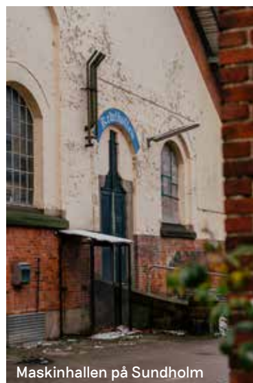
Maskinhallen på Sundholm

"Det er et og alt. Det ville være meget ærgerligt ikke at have dem i ryggen, for de er virkelig nede i alt, hvad der sker i bydelen. De har haft kæmpe betydning for vores forankring i Amager Vest".