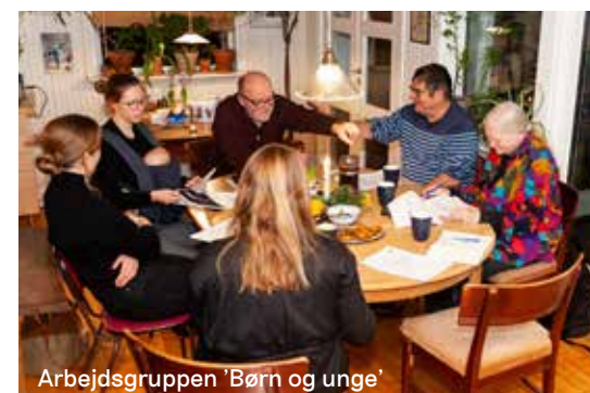
Arbejdsgruppen 'Børn og unge'